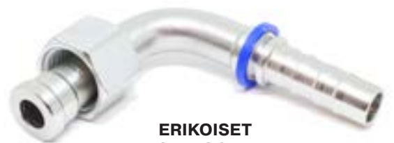
ERIKOISET ASTEKOOT JA PUDOTUSMITAT

Kaikille metsäkonevalikoiman letkuille saatavissa varastosta myös kuorimaton holkkivaihtoehto! (4200-11 / 4200-25 holkki)